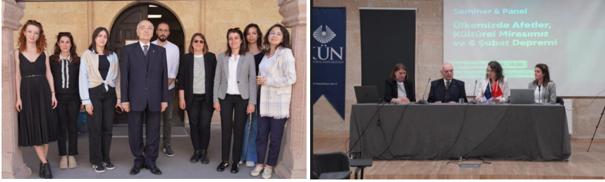
Resim 2-3: Etkinlikten Görüntüler