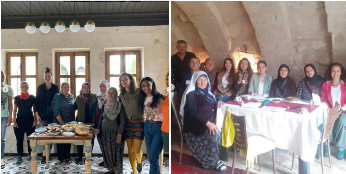
Resim 3-4: Dergilerin Çekimleri Sırasındaki Hazırlıklardan Görüntüler