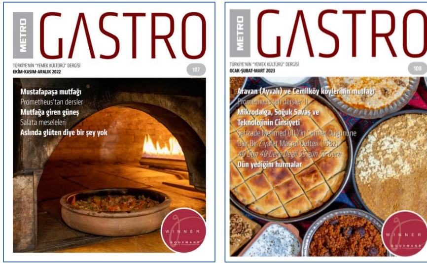
Resim 1-2: Mustafapaşa ve Cemil ile Ayvalı Yemeklerinin Konu Alındığı Dergilerin Kapakları