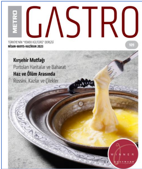
Resim 1: Kırşehir Yemeklerinin Konu Alındığı Derginin Kapağı