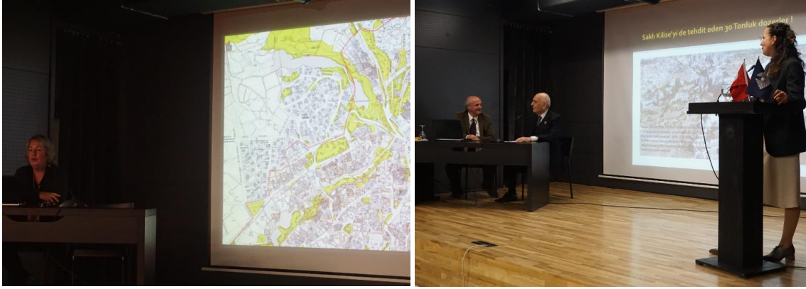
Resim 2-3: Çalıştayın İlk Gün Oturumlarından Görüntüler