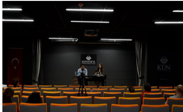
Resim 2-3: Seminerden Görüntüler