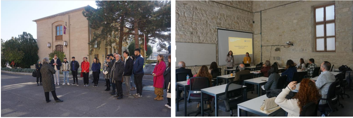
Resim 4-5: Çalıştayın İkinci Günkü Etkinliklerden Kareler: Fabrika Yerleşkesi Gezisi (4); Kapadokya'da Turizm ve Şehirleşme Seminerinden Görüntü (5)