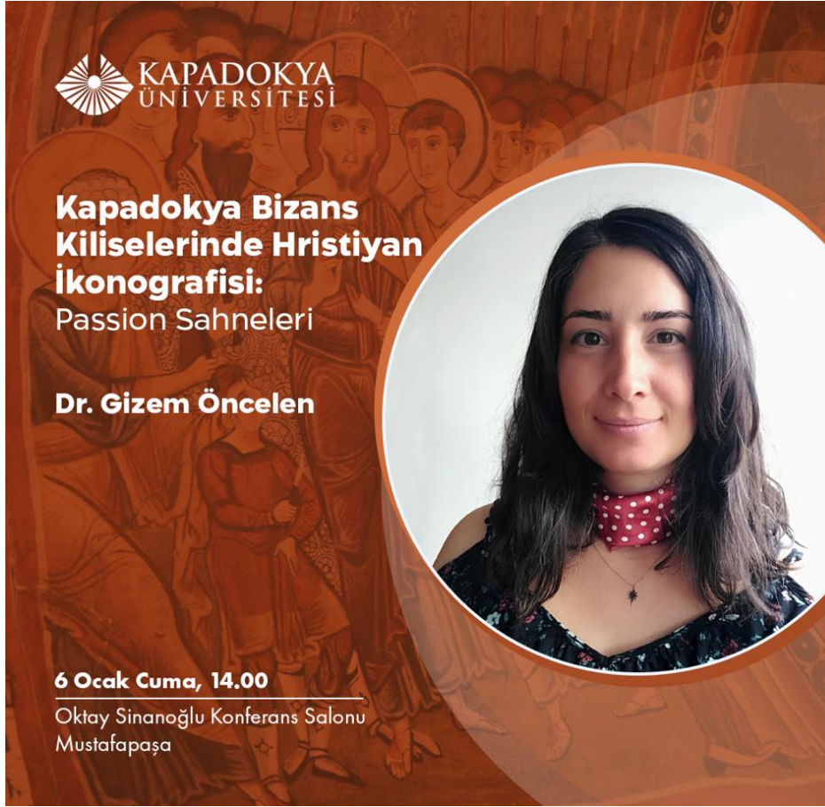
Resim 1: Etkinliğin Afışı