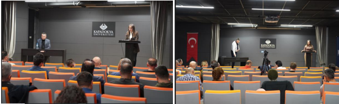
Resim 2-3: Seminer ve Konferanstan Görüntüler