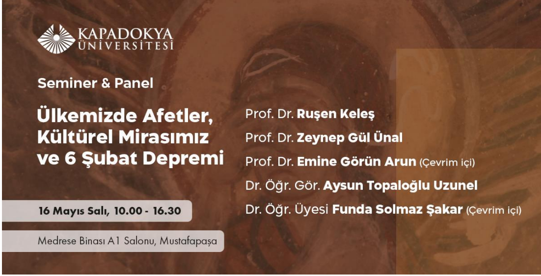
Resim 1: Etkinliğin Afışı