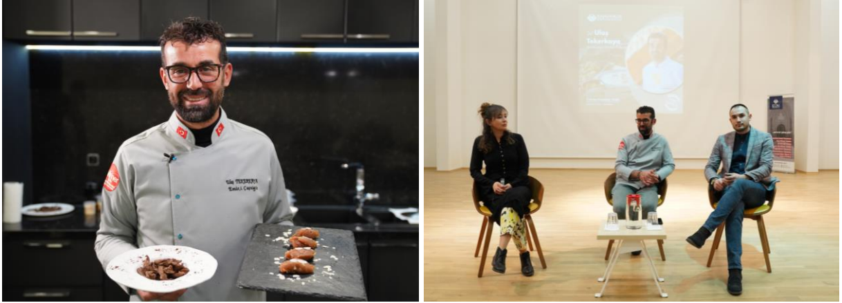
Resim 2-3: Atölye Çalışması (2) ve Seminerden Görüntü (3)