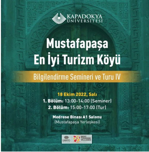
Resim 1: Etkinlik Afışı