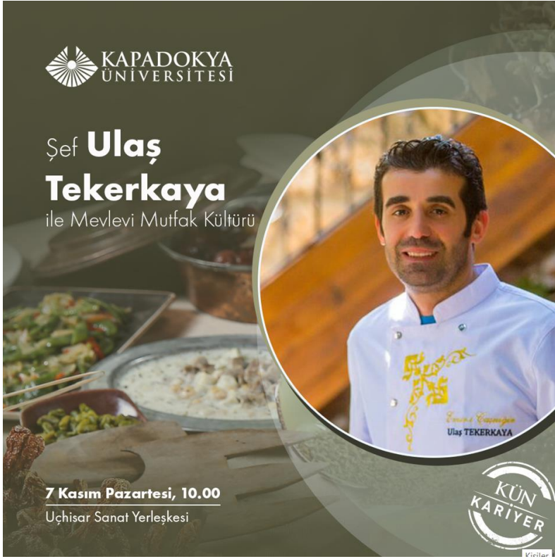
Resim 1: Etkinliğin Afışı