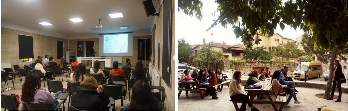
Resim 2-3: Etkinlikten Görüntüler