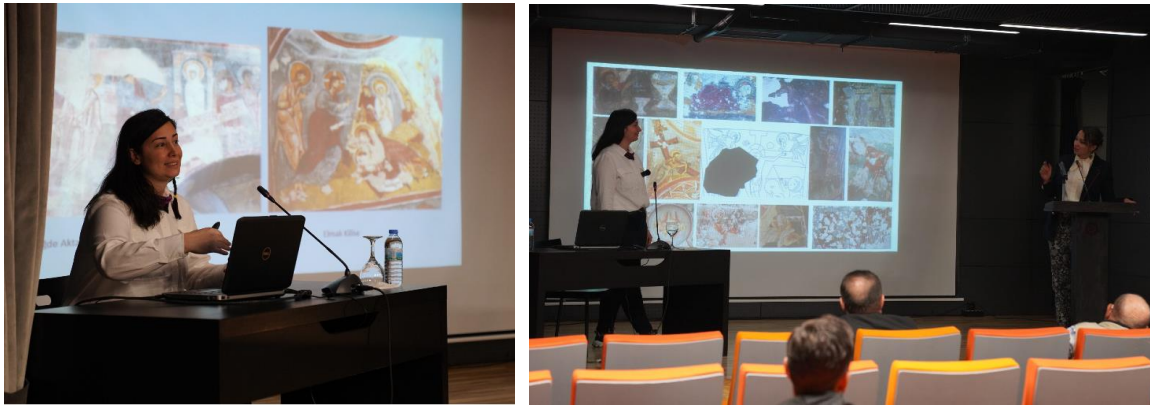
Resim 2-3: Seminerden Görüntüler