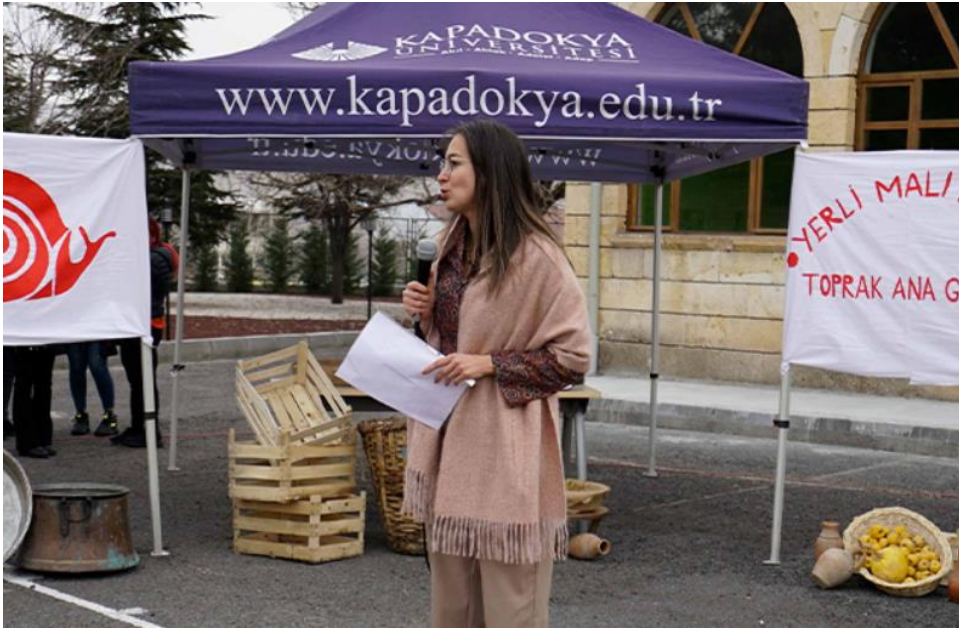
Resim 1-2: Etkinlikten Görüntüler