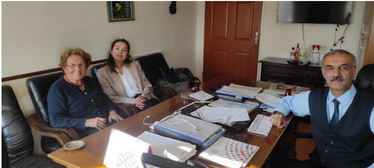
Resim 2: Kırşehir İl Kültür Müdürlüğünde 7 Aralık'ta Yapılan Toplantıdan Bir Görüntü