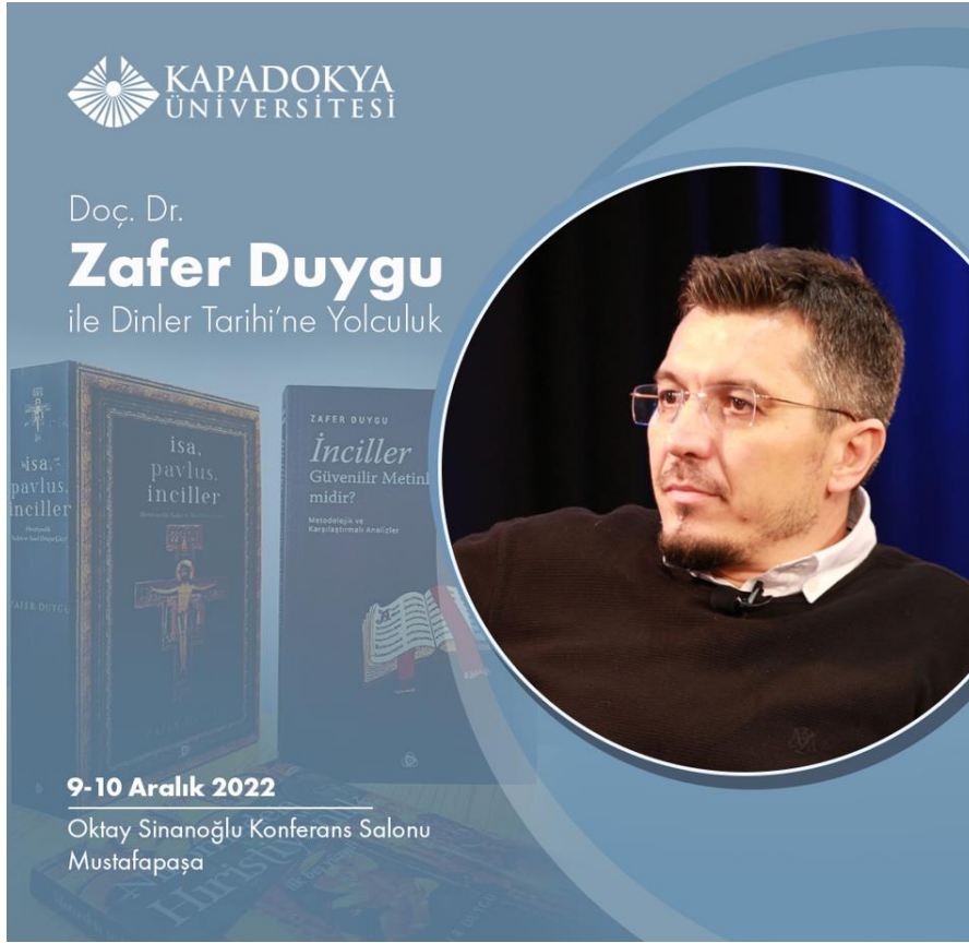
Resim 1: Etkinlik Afışı